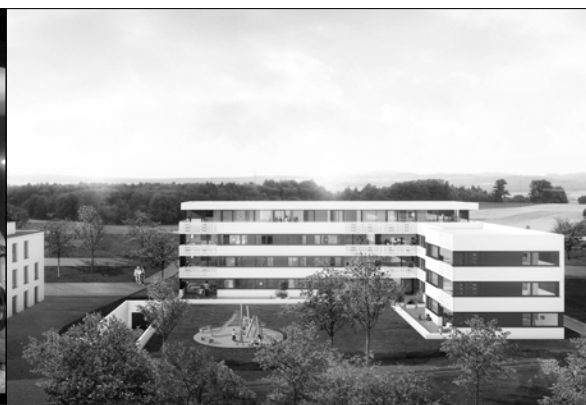
Überbauung Weidepark, Visp, 2016 - 2018