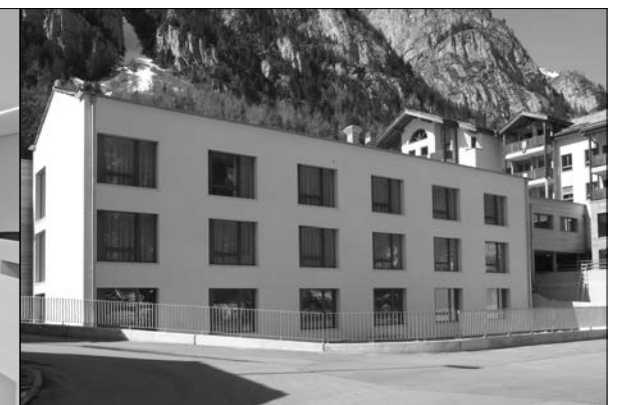
Erweiterung Alters- & Pflegeheim, St. Niklaus, 2006