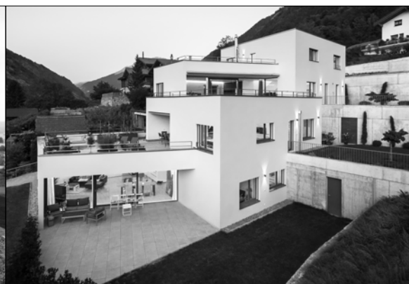
Neubau MFH Trielmatta, Eyholz, 2015