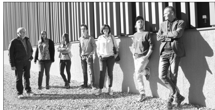
Team BAUATELIER12, 2016

Neben der strikten Einhaltung von Kosten-, Termin- und Qualitätsvorgaben sind wir stets bestrebt mit ästhetisch überzeugenden, innovativen Projekten unseren Beitrag für eine nachhaltig gebaute Umwelt zu leisten.