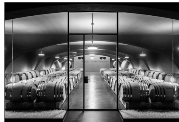
Erweiterung St. Jodernkellerei, Visperterminen, 2015